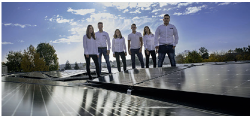
Azubis vor den Sonnenkollektoren auf dem Herrmann-Ultraschall-Firmendach – Zukunft im zweifachen Sinne

In 2018, Herrmann Ultraschall installed a photovoltaic system on the firm's roof in order to obtain 15 - 20% of its own electricity needs from solar energy as from 2019. The electric vehicle charging stations for both the electric firm pool cars are also profiting from this. In total, 30,000 "solar kilometres" have been covered with them and 5,300 kg of CO 2 emissions avoided. The company has also converted all the ceiling spotlights from energy-saving lamps to LED technology and installed a measuring system in order to establish the energy consumption in the production area. In the future, energy-saving concepts for fabrication should be derived from this.